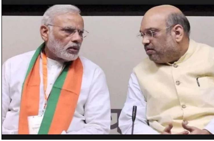
बुधनी से लड़ेंगे शिवराज

मध्यप्रदेश, राजस्थान और तेलंगाना विधानसभा चुनावों को लेकर भारतीय जनता पार्टी ने कई उम्मीदवारों के नामों का एलान कर दिया है। सबकी निगाहें मध्यप्रदेश की सूची पर थी। भाजपा ने मध्यप्रदेश के लिए 177 उम्मीदवारों के नाम की सूची जारी की। इस बार तीन मंत्रियों और 25 से ज्यादा विधायकों के टिकट काटे गए हैं। दो सांसदों और भाजपा में आए तीन निर्दलीयों को टिकट दिया गया है।